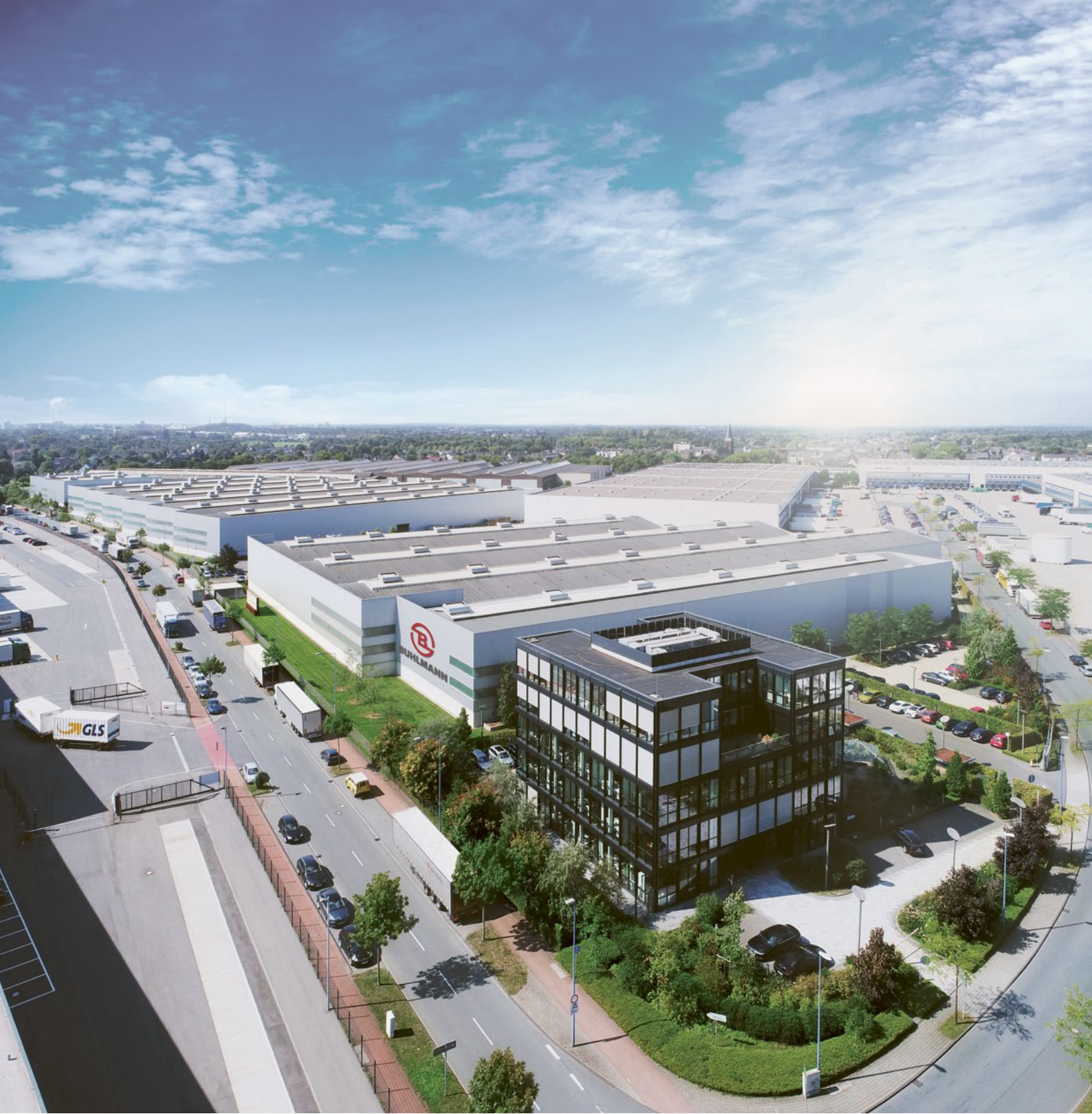
Standort in Duisburg

BUHLMANN Rohr-Fittings-Stahlhandel GmbH + Co. KG Arberger Hafendamm 1 · 28309 Bremen · Germany Telefon +49 421 4586-0 mechanicals@buhlmann-group.com